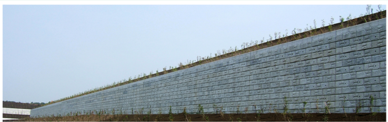
静岡県 工業団地造成 (総延長700m以上、擁壁面積6,000㎡以上)