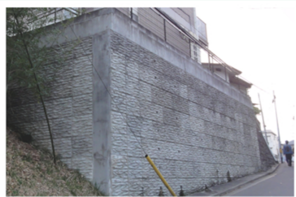
宮城県 仙台市宅地 (東日本大震災でも無傷)