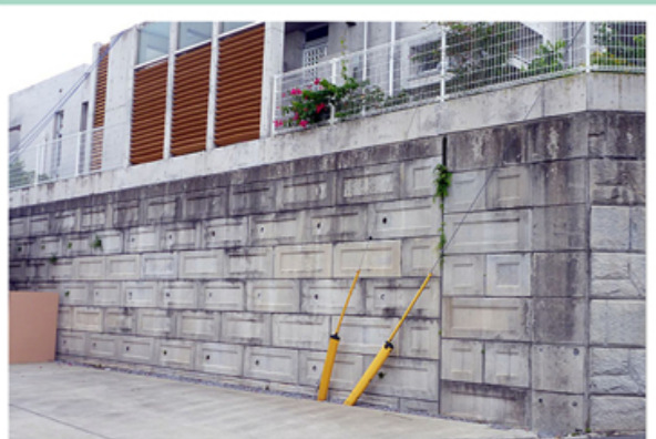
沖縄県 住宅地造成